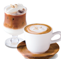
ヘーゼルナッツラテ